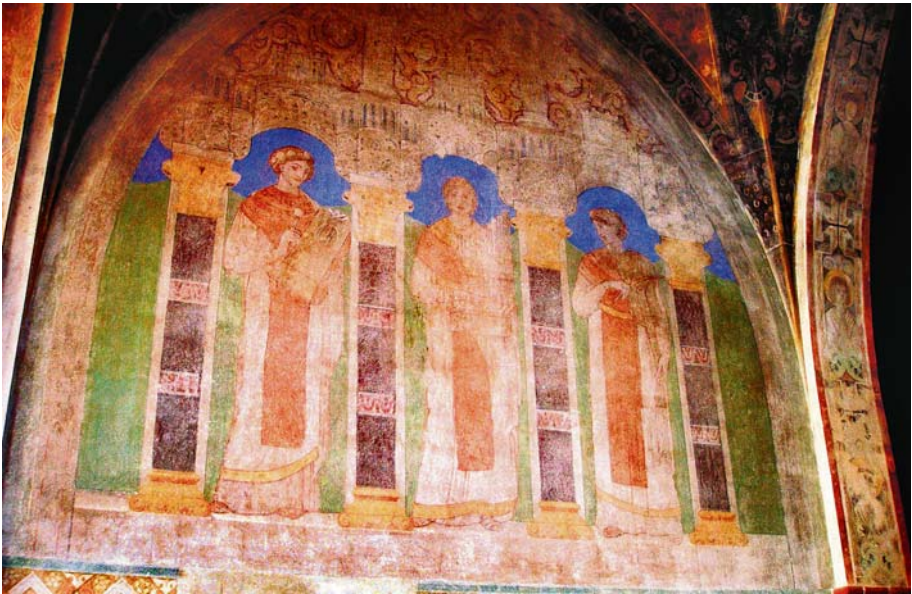
Allegorische Darstellungen der Musik vor der Gottesstadt, Wandbild auf der Orgelempore