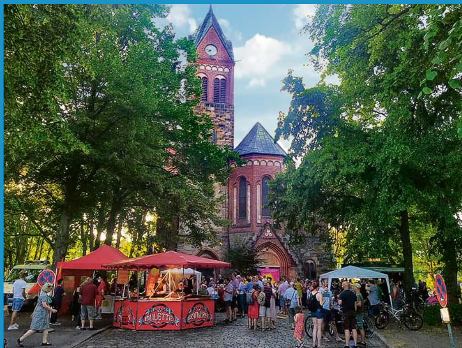
Festival „Fête de la Musique“ zum Sommeranfang am 21. Juni 2021 vor der Friedenskirche Grünau