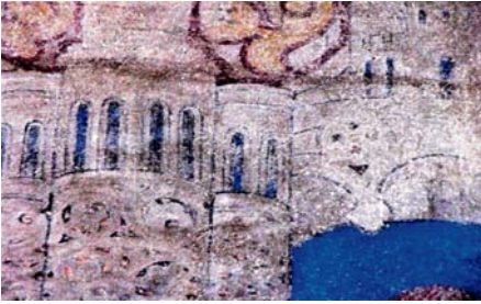
Die auf einem Berg gelegene Gottesstadt hinter den musizierenden Damen, Wandbild auf der Orgelempore

Die Fotos und die Ideen zum Denkmaltag 2021 wurden zum Teil der Broschüre entnommen: