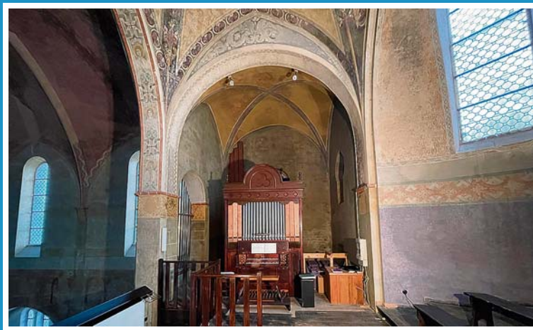
„Die Orgel im Paradies“

Tag des offenen Denkmals, Samstag, 11. September 2021, 16–19 Uhr Ev. Friedenskirche Berlin-Grünau