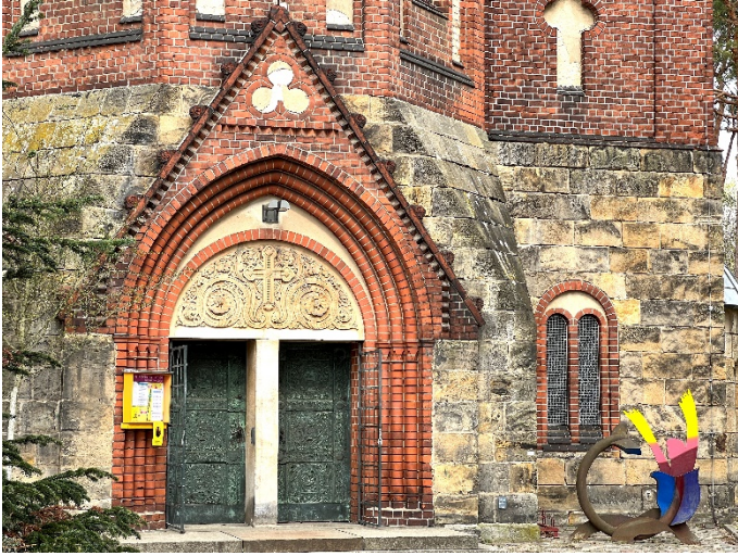
Bild vom Eingangportal