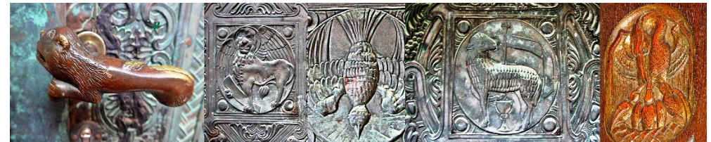
Die Türklinke-ein Löwe Markus der Löwe Taube Lamm Pelikan

An der Fassade der Westseite der Friedenskirche treibt ein Drache sein Unwesen. Und der Teufel soll an der Fassade gespuckt und dabei die hässlichen dunklen Flecken hinterlassen haben. Der Wasserdrache vom Grünauer Wassersportmuseum ist dagegen ein harmloses Wesen. Er schmückt gewöhnlich die langen Paddelboote der Drachenbootfahrer. Die Tradition stammt ursprünglich aus China. Heute werden diese Rennen überall auf der Welt durchgeführt – auch in Berlin-Grünau!